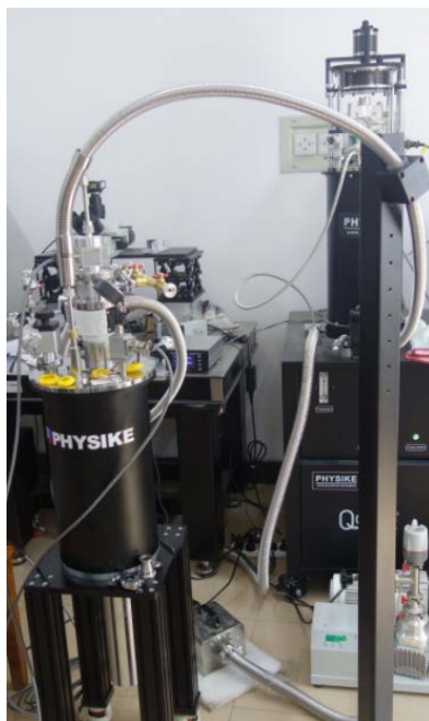
► 用于低维材料拉伸实验的顶部装卸型干式低温系统(Qcryo-SV-400)