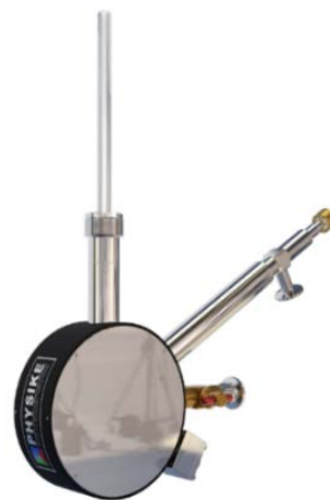
► SV-200 低温恒温器

SV-200 低温恒温器既可使用液氮降温, 也可使用液氮降温, 还可与氮循环低温系统(Qcryo)结合形成闭环干式低温系统, 无需要消耗液氮即可获得 2.5K 的低温。