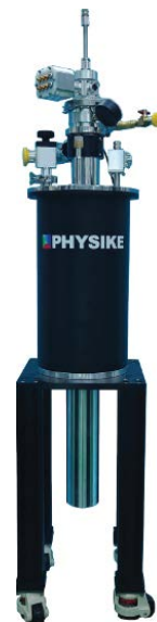
► 用于低维材料拉伸实验的 SV-400 低温恒温器