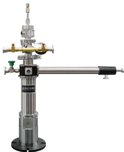
▶ 带四路铍窗的 SV-300 低温恒温器

SV-300 低温恒温器采用消除应力的低温窗，可大大减小样品管安装的低温密封窗在低温下泄漏风险。SV-300 低温恒温器提供多种选配，如样品杆上集成多位置样品座和线性操作器允许在低温下测试多个样品、减小振动的静态交换氦气的样品环境、提供匹配光谱仪的安装法兰以及透射各种波段窗材等。