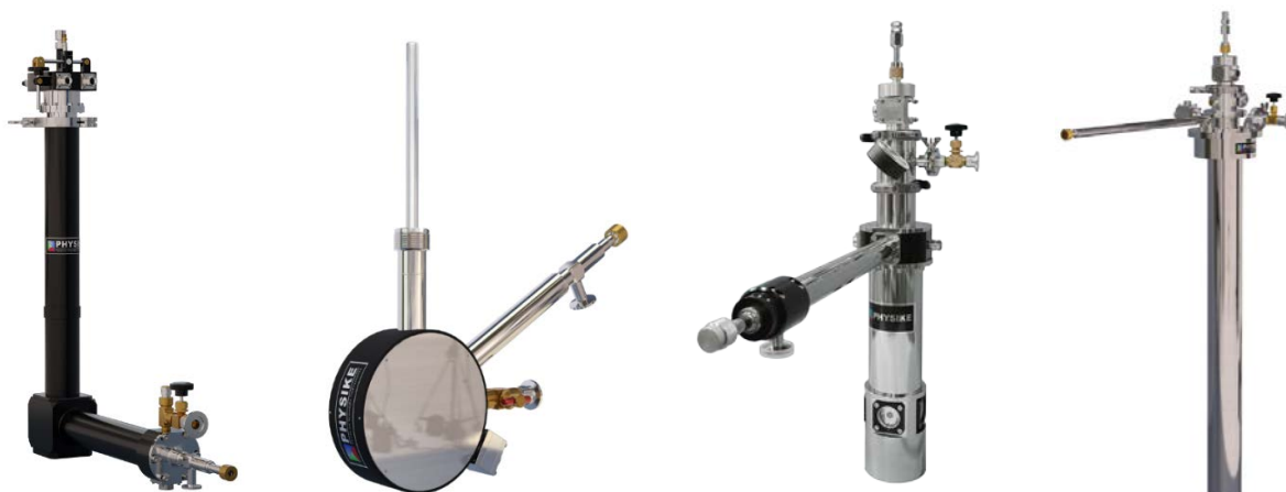
► 几种典型 SV 低温恒温器

SV 低温恒温器具有操作简单、降温速度快和应用广泛等特点, 既可使用液氮降温, 也可使用液氮降温, 还可与氮循环低温系统 (Qcryo) 形成闭环干式低温系统, 无需消耗液氮即可在低温下长时间连续运行, 且保持 SV 低温恒温器典型低振动和低噪音特性, 与使用液氮相比, 大大节省使用费用。