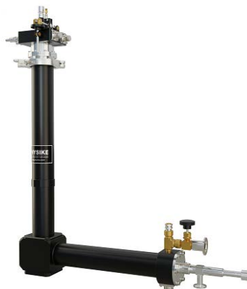
► SV-100 低温恒温器

SV-100 低温恒温器专门为 Q 波段 ESR 谱仪设计，采用“L”外型设计，方便与 ESR 电磁铁匹配，标准 SV-100 样品环境是动态交换氦气，可选配静态交换氦气样品环境。