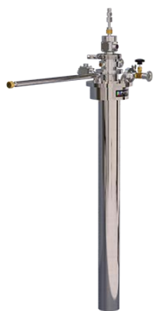
► 匹配 NMR 谱仪的 SV-400 低温恒温器

SV-400 低温恒温器非常合适与 NMR 磁体匹配，例如与典型 9.4T 孔径 89mm 的 NMR 超导磁体匹配的 SV-400 样品管的内径为 65mm，可定制不同外径的尾部来匹配不同孔径的磁体。