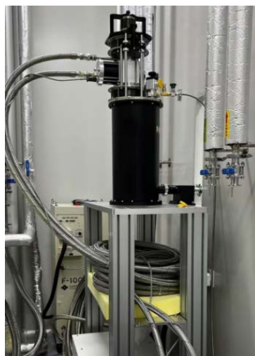
► 大样品腔顶部装卸型干式低温系统(型号: Qcryo-SV-400)