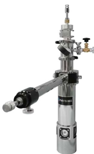
▶ 带四路石英窗的 SV-300 低温恒温器

SV-300 低温恒温器的冷氦气环境可充分冷却热导性能不好的样品(比如不锈钢、陶瓷)、形状不规则的样品(比如 DAC 压机)以及粉体和液体样品，而尾部的四组光学窗口非常方便进行光学实验。